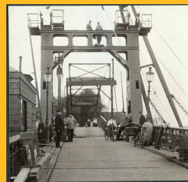
De Zaanbrug krijgt een nieuw brugdek, 1926.

Het moment dat afscheid genomen moet worden van de bestaande Zaanbrug komt dichterbij. Met de campagne 'Mijn Zaanbrug' hebben veel bewoners meegedacht over de uitstraling van de nieuwe Zaanbrug. De komende tijd gaan we onder deze noemer een nieuw initiatief starten. We zijn benieuwd wat de Zaanbrug voor u betekent. Is het gewoon een brug waar u gebruik van maakt als verkeersdeelnemer of heeft u er speciale herinneringen aan. Met uw verhalen willen we de geschiedenis van de Zaanbrug en haar voorgangers opnieuw laten vertellen. In een volgende nieuwsbrief meer hierover. Wilt u nu al een speciale herinnering aan de Zaanbrug delen met de lezers? U kunt uw bijdrage sturen naar vaartindezaan@noord-holland.nl .