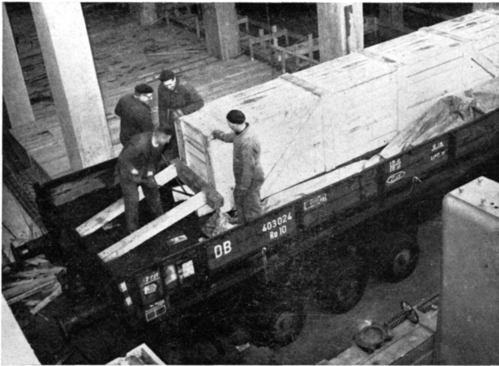
In de nieuwe fabriekshal wordt de wagen gelost