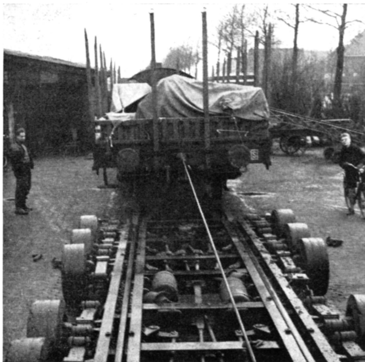
De goederenwagen wordt op de „roller” getrokken

met de Amerikaanse „spiralende” ronde celconstructie