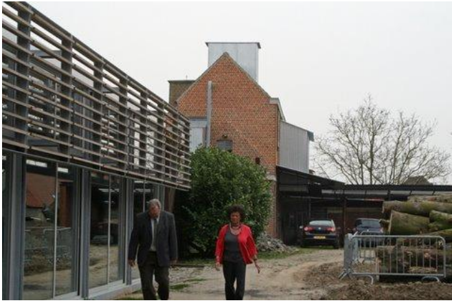
De maalderij, olieslagerij en zagerij Vancoillie in Lichtervelde. Links het nieuwe bezoekerscentrum.