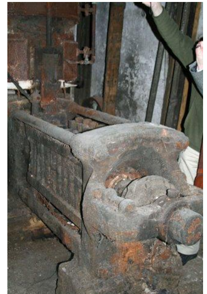
De hydraulische oliepers.