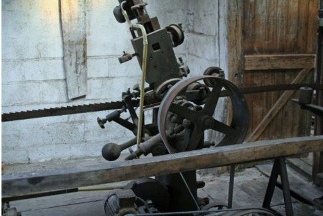
Een werktuig om de zagen te slijpen.