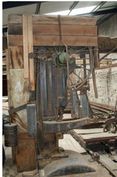
De zagerij: een Hybride bandzaagmachine van balken en gietijzer. Het lijkt een eigen maaksel.