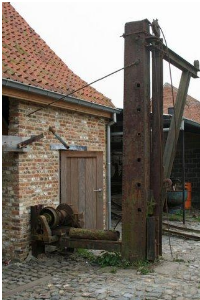
De kraan is ook een staaltje zelfwerkzaamheid. Hij bestaat o.a. uit een stuk geklonken molenwiek, wat ijzeren balken en een Amerikaanse lier.