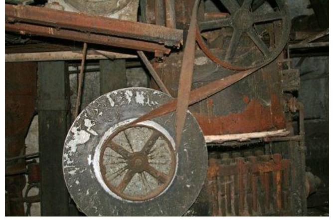
De riemen in het drijfwerk zijn onderdeel van de tijdscapsule. Ze zijn waarschijnlijk niet volstrekt betrouwbaar.