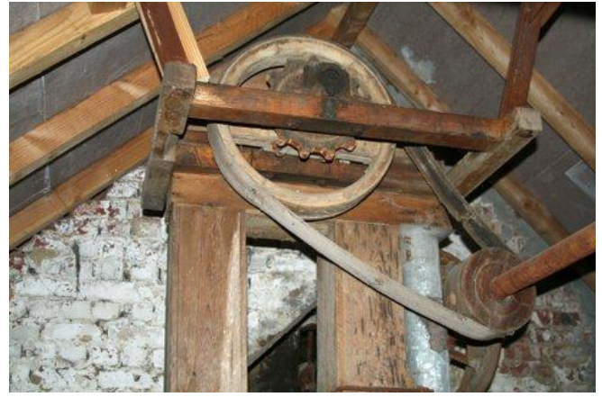
Een drijfwerk met houten en ijzeren onderdelen.