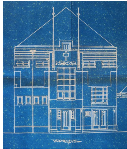
Links de St. Jozefschool aan de J. Sijbrandsteeg uit 1919. Rechts de bouwtekening van de R.K. Volksbond aan de Oostzijde uit 1926.