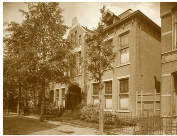
Links het R.K. St. Jan Ziekenhuis uit 1932. Rechts zusterhuis St. Josephgesticht aan de Oostzijde 18 uit 1907.