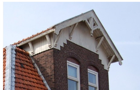
Oostzijde 395 uit 1904

Expressieve topgevels, veel detail in gootklossen, dakgoten en gevelbeëindigingen, dakoverstekken dat zijn allemaal elementen die S.B. van Sante vanaf dat moment steeds vaker gebruikt in zijn ontwerpen.