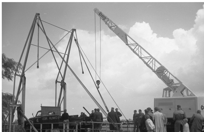
De Robbrug in de Zandammerstraat werd gedeeltelijk gedemonteerd